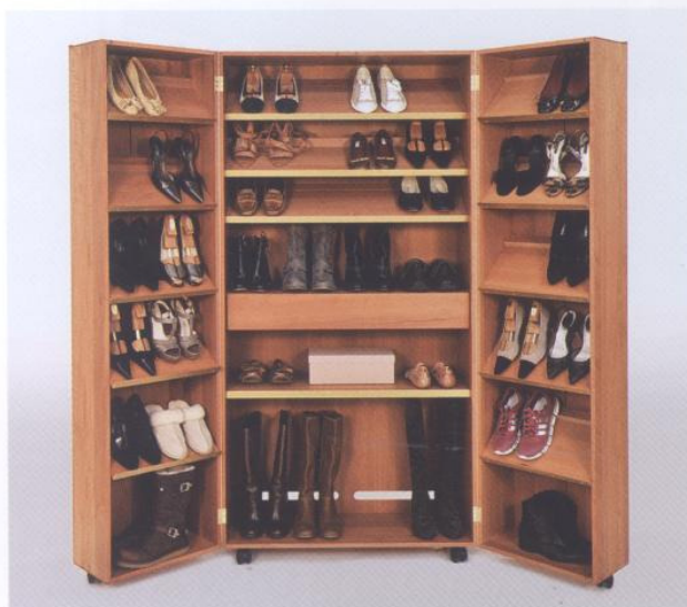
■ Geöffnet präsentiert er die Schuhkollektion im besten Licht.