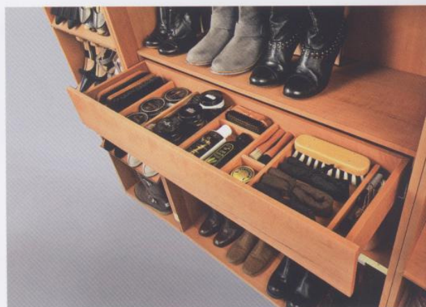
■ Es gibt ein Modell für Damen- und eines für Herrenschuhe.